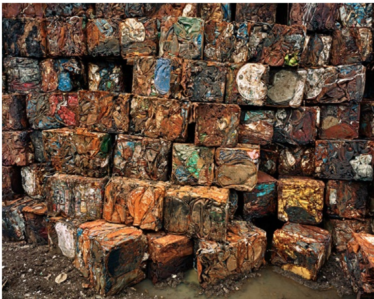
Barils de pétrole compressés 4 Hamilton, Ontario, 1997 Edward Burtynsky