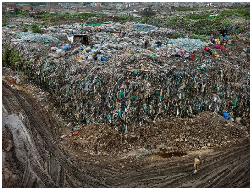
Décharge de Dandora 1 Nairobi, Kenya, 2016 Edward Burtynsky